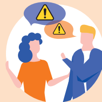
Familien- und Freundeskreis, Nachbarschaft